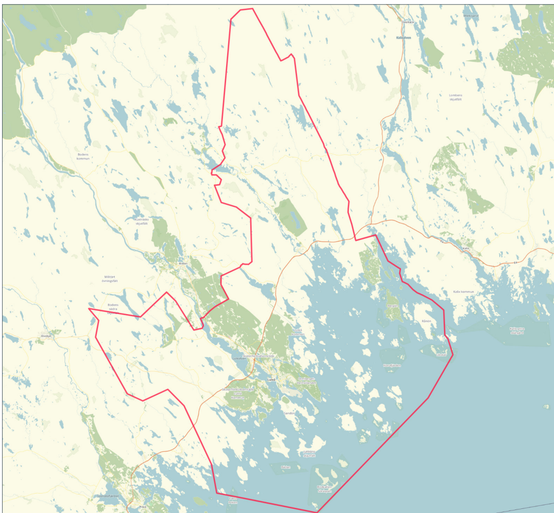
Figur 1: Karta över Luleå Energi Elnät AB:s koncessionsområde.